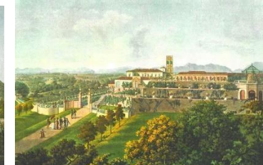
Lesmo - Il Gernetto