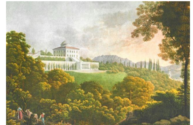
Inverigo - Villa Cagnola